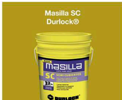
Masilla SC Durlock®