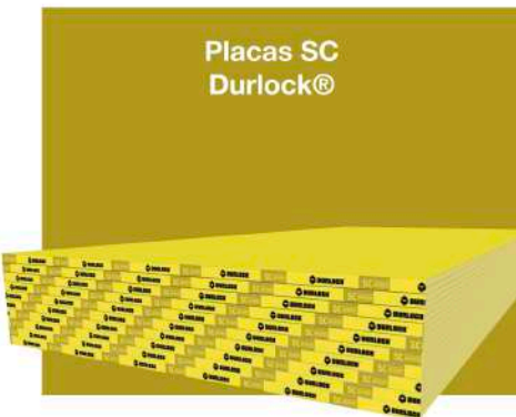
Placas SC Durlock®